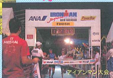
アイアンマン大会