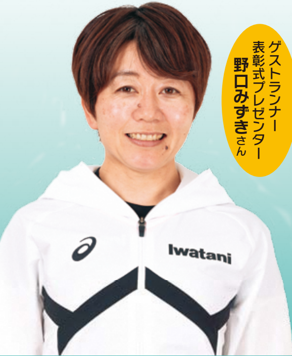
ゲストランナー 表彰式プレゼンター 野口みずきさん