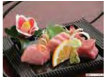
五島産近代マグロ