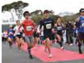
さあ、いっせいにスタート！

スタート・ゴール ● 道の駅 遣唐使ふるさと館 住 所 ● 五島市三井楽町濱ノ畔3150-1 主 催 ● 五島つばきマラソン実行委員会 (☎0959-84-3363)