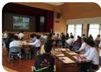
▲6月4～5日に行われた「まちづくり研修会」の様子。各まち協の会長・会員さんをはじめ、集落支援員も今後の人口推移に合わせたまちづくりを学びました。