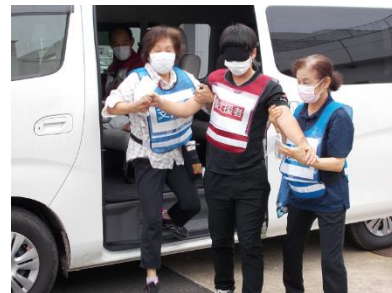
奈留地区での避難訓練の様子

岐宿では今年度、各町内会ごとに防災組織としての組織図づくりに取り組み、今後の防災に活かす計画です。