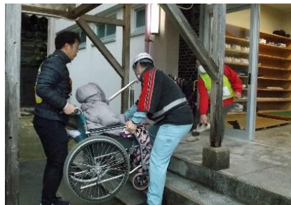
奥浦地区の避難訓練の様子