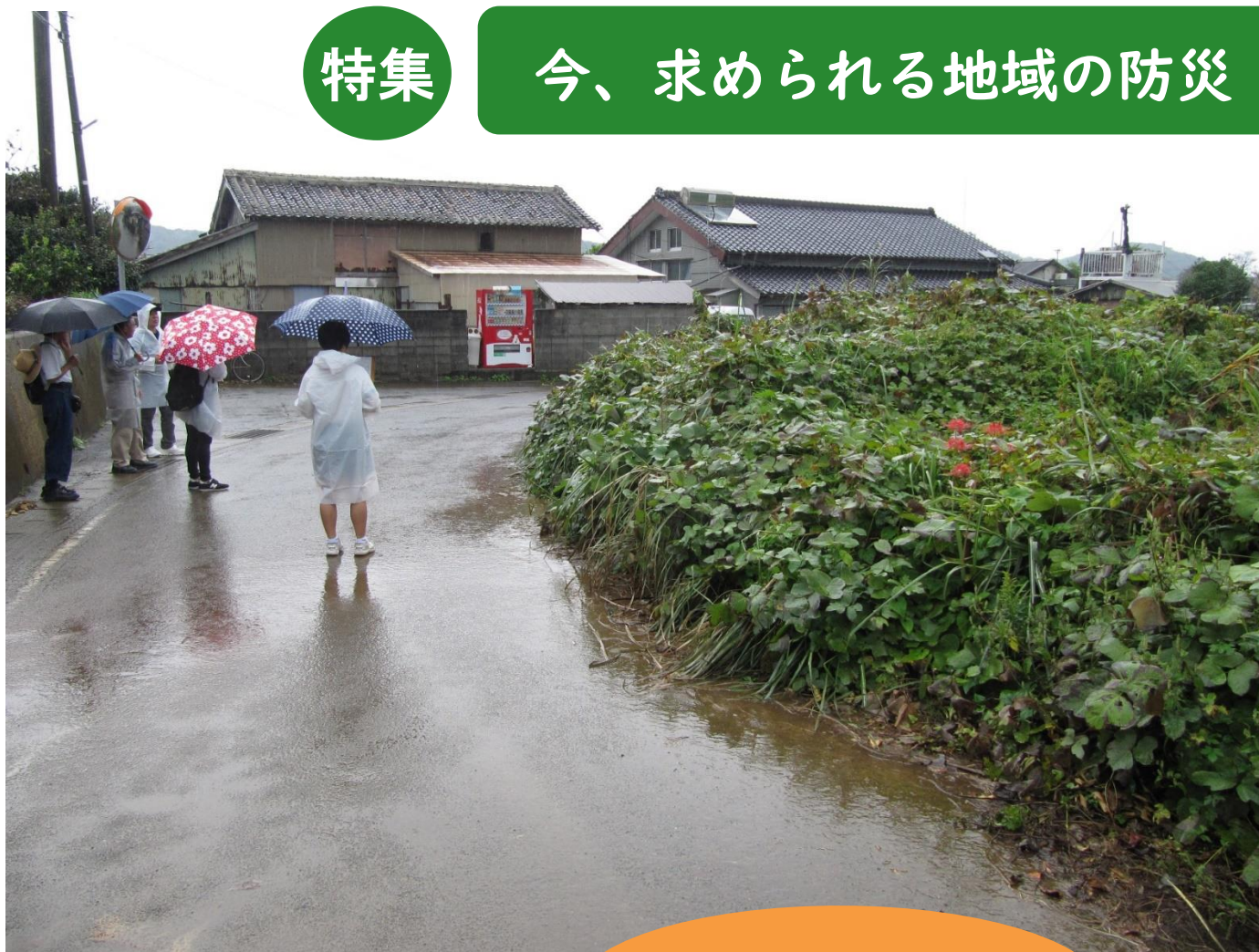
緑丘地区での危険箇所の確認の様子