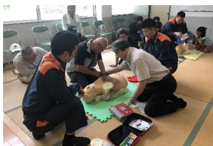
大浜地区のAED講習会の様子

ここ数年「50年に1度の大雨」が頻発しています。7月の豪雨により各地域では河川の氾濫などの大きな被害をもたらし、五島市内でも大雨による土砂崩れなどがありました。改めて防災について考え、備え、地域で取り組んでいきましょう。