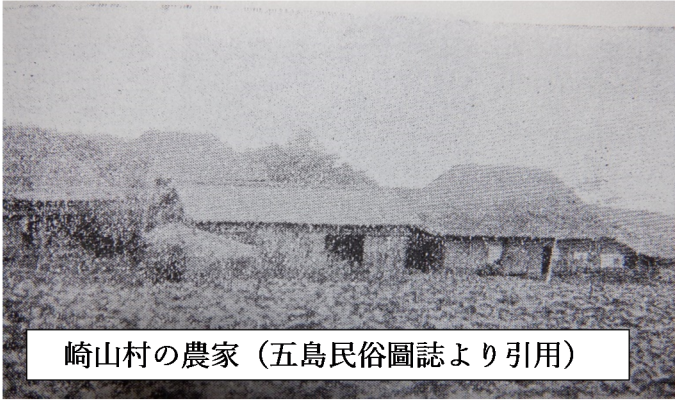
崎山村の農家（五島民俗圖誌より引用）

大正7年 へんさん 編纂の崎山村郷土誌には、「今より二三十年前まで、大部分草葺 くさぶき の家にすみたりしが、生活程度 こうじょう の昂上せしと、毎年数度の祝融の災ありて、草葺の家は類焼の難に遇ひしより各区域一團となり瓦家講を盛り立て、講金を與て瓦家を改築又は新築するの資に充てしめ漸次 ぜんじ 瓦家となり、今日にては村中に一軒も草葺の家なきに至れり。」とあることから写真の農家は明治30年代の家であろうか。