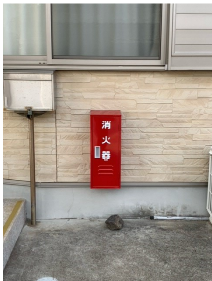
【上崎山公民館正面ポストの横】

3月1日～7日までの1週間は『春季火災予防運動週間』でした。まだまだ空気も乾燥していて、風も強かったですね。