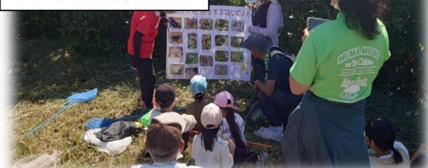
火の岳山頂蝶々調査