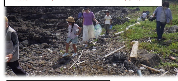
海洋ゴミ（ペットボトル100本）調査