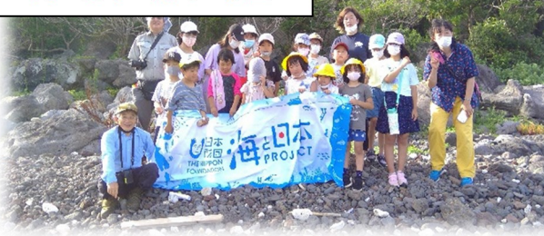
海と日本 海辺の教室