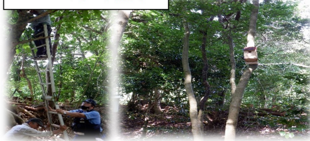
コダ里山鳥の巣箱設置