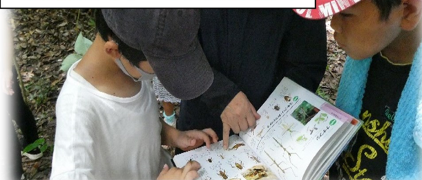
鏡瀬昆虫公園・コダ里山昆虫調査