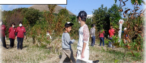
昆虫公園記念植樹祭