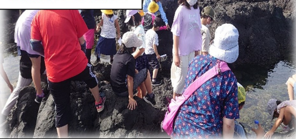
覚仙海岸生き物調査