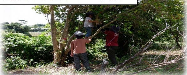
鏡瀬昆虫公園昆虫トラップ仕掛け