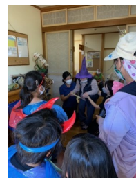
ゆたっとハウス みはらし荘