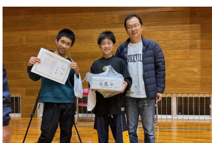
1位:ダイゴリラチーム