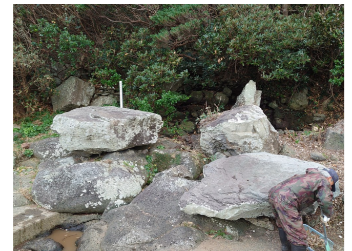
（長手・真佐手川清掃の様子）