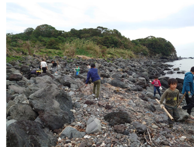
（釣箱海岸清掃の様子）

昨年9月、台風の影響で崎山地区も大きな被害を受けました。倒木の処理など、各町内会役員の方々のご尽力により、崎山地区の道路も早く通行できるようになりました。史跡も台風被害を受け、長手地区にある真佐手川の整備（倒木の処理やゴミの回収・看板の立て直しなど）を行い、真佐手川はすっかり綺麗になりました。さらに貝の瀬の碑では、草刈りや石碑文字の改装をして、今まで読み取れなかった史跡の文字がはっきりわかるようになりました。上崎山地区の釣箱海岸においては、崎山児童クラブの子ども達が一生懸命に掃除をしてくれて、短時間で海岸が綺麗になりました！