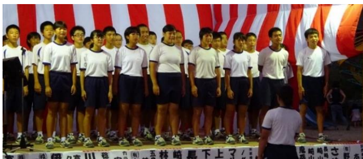
中学生による合唱「クスノキ」「まかぜ」