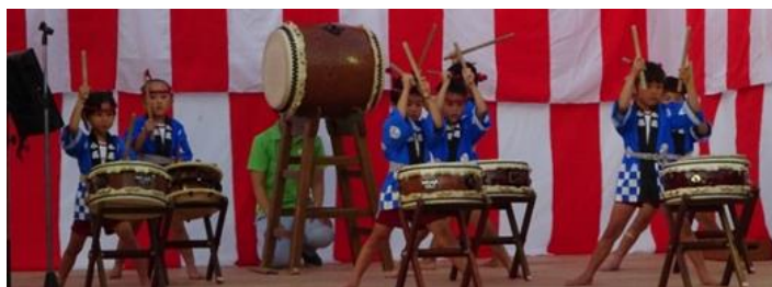
崎山保育園 年長さんによる和太鼓「パプリカ」「いだてん」

今回のまち協通信は夏まつりの特集しております!!当日、来れなかった方も写真を見てお楽しみいただければ幸いです。