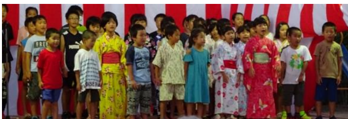
小学生による合唱「崎山小学校校歌」「パプリカ」