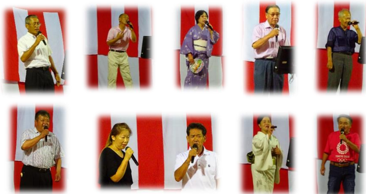
町内会代表によるカラオケ