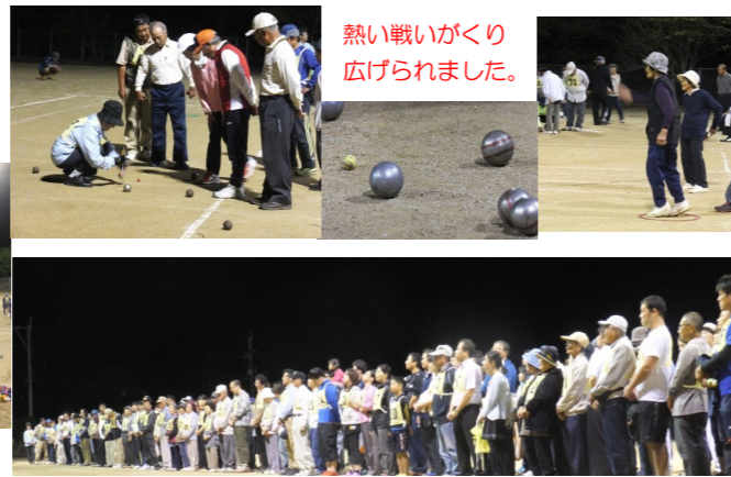
熱い戦いがくり広げられました。

10月2日のどしゃぶり、連日の通り雨等でグラウンド状況も心配されましたが、定刻の時間になると天気も回復し、無事開催することができました。