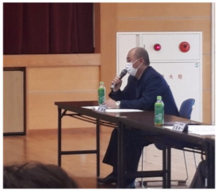
昨年12月10日(木)に行われた、奥浦地区役員会に地域協働課が参加された時の様子です。

この評価から、現在のまちづくり協議会は、将来への目標が明確化されておらず、取り組むための仕組み作りも構築されていない地区が大変多いことが考えられるので、改善案としまして、行政、地域が目指す方向性の共有と、地域ニーズに配慮されているのかを再度考え、まちづくり協議会が目指す将来像と具体的な取り組みについて、各地区で意見を取り纏めることとなりました。