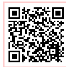
五島市まちづくりサイト 各協議会の情報を見る