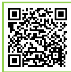
おくら夢のまちづくり協議会広報誌 奥浦まち協の過去の広報誌

おくら夢のまちづくり協議会の情報や五島市の情報、『五島市まるごと公式サイト』や『五島市まちづくり協議会インスタグラム』がパソコンや携帯からご覧いただけます。 まずは、右側のQRコードを読み取り、ご覧ください。