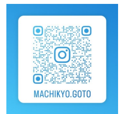
五島市まちづくり協議会 インスタグラム 五島市各協議会のInstagram