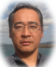
環境保全 入口 信 部会長

保健福祉部会では、高齢化が進む中、近所に店がないという奥浦地区の地域課題に対応するため『買物支援事業』を軸に活動し、現在、奥浦・浦頭・樫ノ浦・平蔵南河原・戸岐・宮原・観音平・半泊の9地区の住民の方々が利用されています。交通手段がなく、買い物にお困りの方は『買物支援事業』をご活用下さい。また同時に『買物支援事業』を支えるドライバーや買物補助員に御協力いただける方も募集しています。奥浦地区住民皆様の暮らしのお役に立てるよう保健福祉部会メンバー一同頑張って参りますので、本年もよろしくお願いいたします。