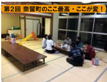
第2回 奈留町のここ最高・ここが変！ こんなに机を用意したけれど… 寂しく開催した日もありました。

10月9日～11月6日の5週に渡り、地域のみなさんといろんなテーマで奈留のこれからを話しました。「もう誰も来ないのでは…」と用意した軽食を目の前に、絶望しかけた日もありましたが、小さな子ども連れのお母さんたちに多くご参加いただき、普段のまち協の会議では会えない人たちと話すことができました。「子どもの今後が心配だから」、「チラシを見て来ました！」と集まって下さったみなさんの気持ちが、今後のまちづくりには不可欠だと痛感。今回の参加者は、移住者や転勤者のいわゆる“よそ者”の方が多かったです。地元のこと以上に奈留のことを考えてくれた姿は多くの方に見ていただきたい光景でした。また、島トークで出た意見は、まち協の役員会等で実現に向けて話し合っていきます。意見の一部は裏面にまとめています。その中で「これは自分たちでやってみたい！」と思った方は、ぜひ事務局までお知らせください！