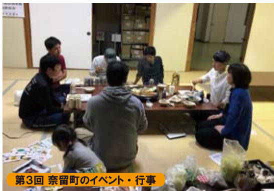
第3回 奈留町のイベント・行事

10月9日～11月6日の5週に渡り、地域のみなさんといろんなテーマで奈留のこれからを話しました。「もう誰も来ないのでは…」と用意した軽食を目の前に、絶望しかけた日もありましたが、小さな子ども連れのお母さんたちに多くご参加いただき、普段のまち協の会議では会えない人たちと話すことができました。「子どもの今後が心配だから」、「チラシを見て来ました！」と集まって下さったみなさんの気持ちが、今後のまちづくりには不可欠だと痛感。今回の参加者は、移住者や転勤者のいわゆる“よそ者”の方が多かったです。地元のこと以上に奈留のことを考えてくれた姿は多くの方に見ていただきたい光景でした。また、島トークで出た意見は、まち協の役員会等で実現に向けて話し合っていきます。意見の一部は裏面にまとめています。その中で「これは自分たちでやってみたい！」と思った方は、ぜひ事務局までお知らせください！