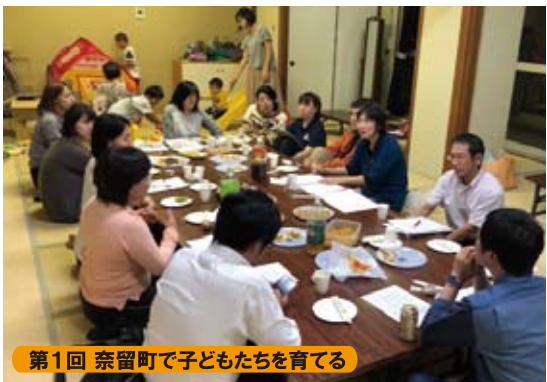
第1回 奈留町で子どもたちを育てる