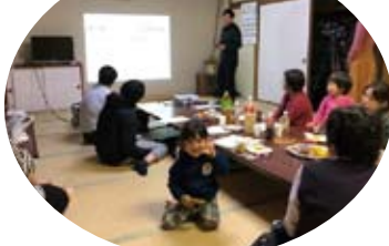
最終日は、五島チャンネルの取材が ありました。近々放送されるかも！？