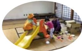
もはや子どものハロウィン大会 になった日も…。 (確かにネクスト世代だけ…)