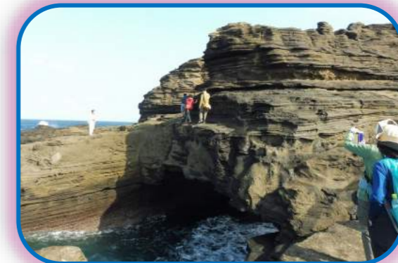
(写真は昨年度のものです。)