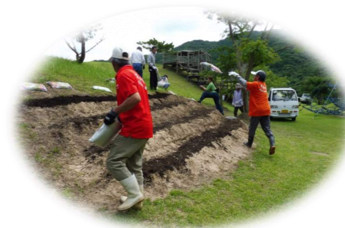
(写真は昨年度のものです。)

地域おこし会「万葉の風」さんが行う、彼岸花球根植栽活動です。秋になる頃、色鮮やかな沢山の彼岸花を見れるのが楽しみです。コロナウィルスが収束し、ご家族、お友達と皆一緒に公園を散歩して花見を楽しめたらいいですね。