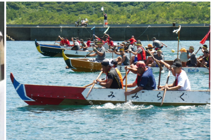
*写真は、昨年開催されたものです。