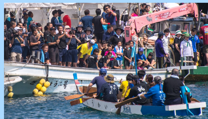
『三井楽地区教職員チーム』とそれを応援する地域の皆さん