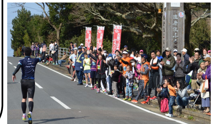
(遣唐使ふるさと館横国道にて)

約800名のランナー達が三井楽半島を駆け巡ります！ 毎年、沿道での温かいご声援ありがとうございます。