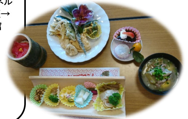
昨年振舞われた昼食