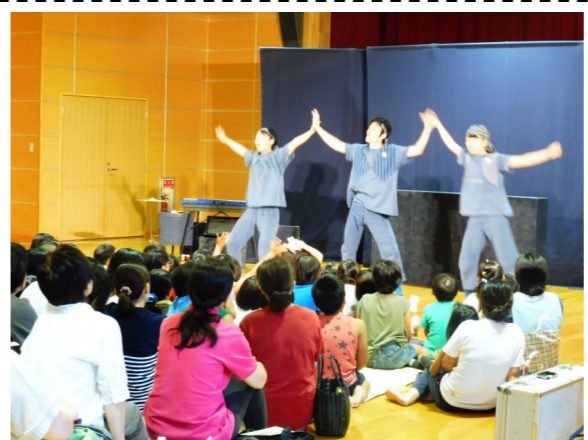
*写真は、昨年開催されたものです。

日 時：7月21日(金) 時 間：未定(後日、公民館だよりに掲載予定) 場 所：三井楽町公民館 入場料：大人 500円、子供 300円 内 容：さんさん劇場による 舞台劇 『昔話のさんさん劇場』 お問い合わせ先 三井楽バラモンキッズ実行委員会 事務局 090-9490-7035(島)