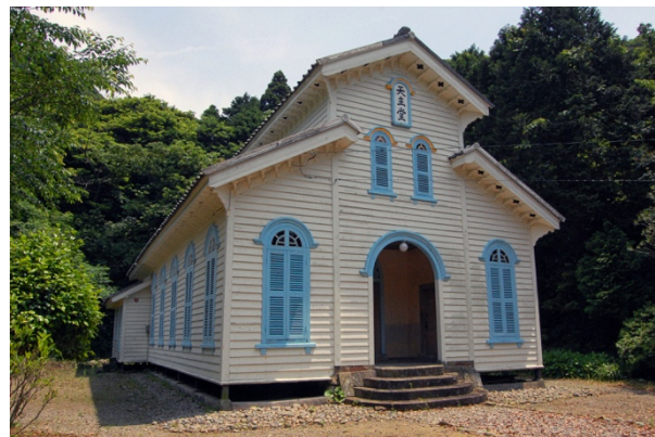
写真6 ● 江上天主堂

久賀島の北東、五島列島のほぼ中央に、いくつもの入り江がありヤツデの葉のような形をした奈留島があります。江上は、奈留島の中央北部にある早房山の南麓に位置する大串湾に近い河川が開削した土地で、広さはわずか奥行約300m、幅約100m足らずの平地です。当初は木々に覆われ、海岸の砂浜もわずかの広さでした。広めの平地は仏教徒の先住民が占拠しており、移住者は外海での石積みの技術を導入し、狭い土地に家や水田、周囲の斜面に畑を作りました。外海からの移住者はもともと漁師であり、漁に制限があった場所もありましたが、大串湾では漁業権が確立して