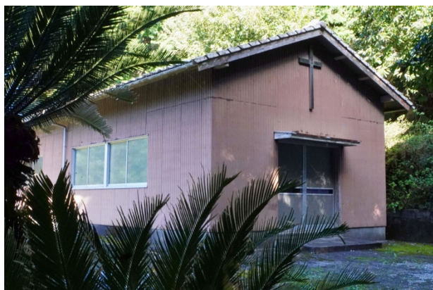
写真13 ● 人里離れた山の中に建つ旧繁敷教会

信仰の場である教会（写真13、14）を訪ね、静謐 せいひつ な祈りの空間に身を置くことで、歴史と精神文化の深層に触れることができます。さらに、教会巡礼は宗教的体験であると同時に、ジオパーク的視点から島嶼の地質・地形と文化の相互作用を学ぶ契機ともなります。