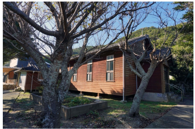
写真 12 ● 半泊教会

ラス越しに見える蒸溜器は、ひとびとの祈りを具現化した祈りの炎のように輝き、訪れるひとびとに静かな時間をもたらします。まるで祈りともものづくりがともに息づく、現代の小さな聖堂のような空間です。ジンは元々薬用として生まれ、イタリアの修道院で蒸溜されていたといわれています。その歴史にオマージュするかのようなクラフトジンは、“GOTOGIN”と名付けられ、この半泊という場所で紡がれてきた風景や歴史、そこでのひとびとの生活が結びついた風土をもつ酒造りが行われています。