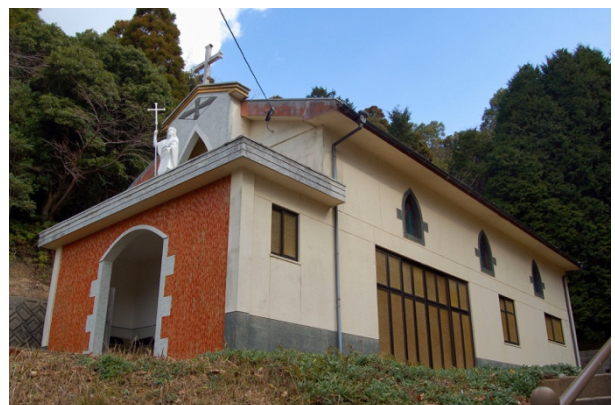
写真3 ● 牢屋の窄殉教記念教会

久賀島は五島列島の南部に位置し、北側から中央部に向かって湾入する久賀湾を中心とし、そのまわりを山の地形が ばてい 馬蹄形に取り囲む、周囲が約52 kmの五島市の二次離島です。