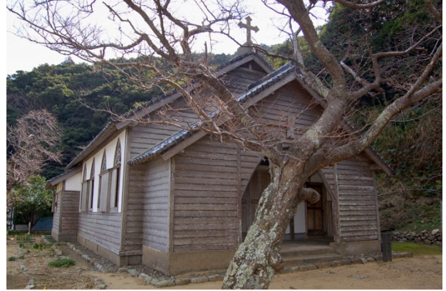
写真7 ● 旧五輪教会堂

この頃に建てられた代表的な教会堂が、 ひさかじま 久賀島の港にある旧五輪教会堂です（写真7）。木造建築で瓦屋根、簡素な佇まいは一見民家のように見えます。しかし、その内部は ろう 三廊式で、天井は本格的なリブ・ヴォールト構造、ゴシック風の祭壇が設けられた西洋の教会堂らしい豊かな空間が広がっています。この頃の教会堂の多くは、木造の住宅を改修した小規模なものでした。信徒は、貧しい暮らしにもかかわらず、多額の費用を寄進や積立によって賄いながら建築を進めました。旧五輪教会