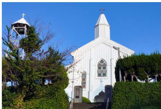
写真8 ● 水ノ浦教会