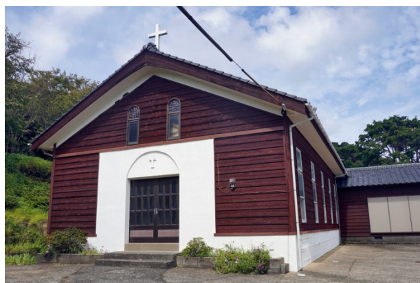
写真14 ● 二次離島にある嵯峨島教会