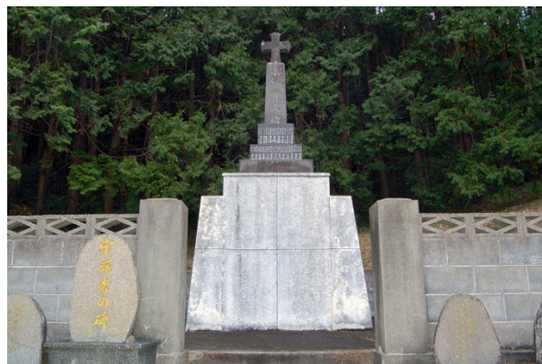
写真4 ● 牢屋の窄殉教地の石碑

16世紀後半から17世紀初頭にかけて、久賀島にもキリスト教が伝わったようですが、禁教によりいったん姿を消し、18世紀には仏教集落のみがありました。1797年、五島藩の開拓移民政策により外海地区から潜伏キリシタンが移住し、既存の仏教集落の周囲や離れた場所に集落を作りました(写真5)。移住先は農業には適さず、移住したひとの数では自力での開拓は困難であったため、仏教徒の水田の隣に新たな水田を作ったり、仏教徒が行う農業や漁業において協働作業をするなど、仏教徒との間に互助関係を築いたともいわれています。その一方で、集落ごとに指導者を中心とする共同体を維持し、密かなキリシタンとしての信仰を続け、中国製の白磁の観音像を聖母マリアに見立てた“マリア観音”に密かに祈りを捧げた集落もあります。久賀島は、解禁直前に潜伏キリシタンへの弾圧が加えられた最後の現場であり、牢屋の窄跡には殉教者を弔うための教会堂と記念碑が建てられています。