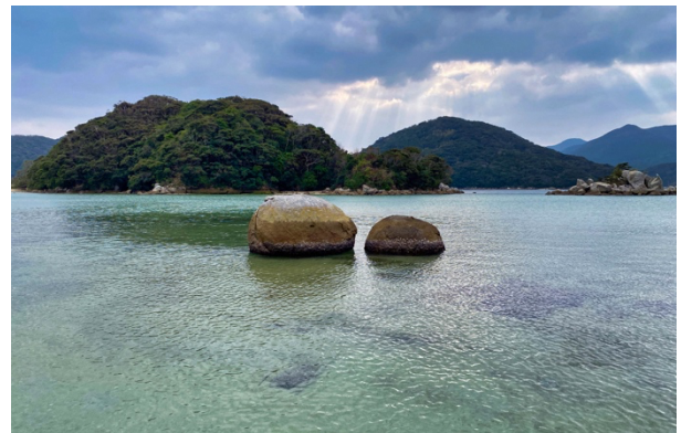
写真 2 ● リング石