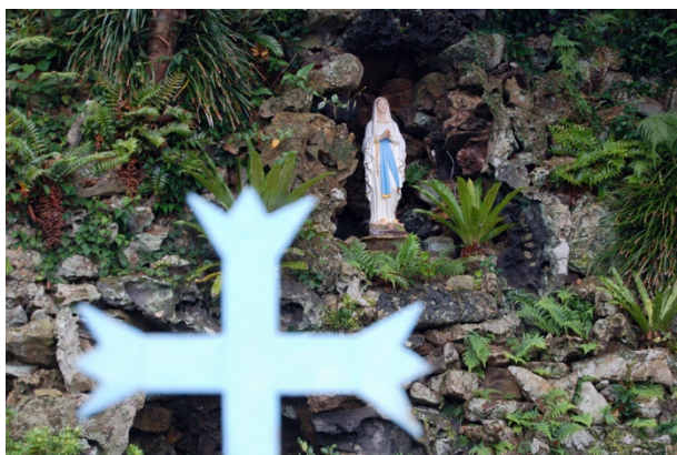
写真9 ● ルルドの洞窟と聖母像 (井持浦教会)