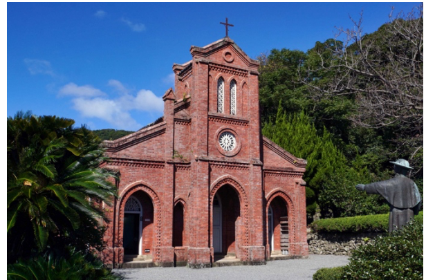
写真 1 ● 堂崎教会

禁教令が解かれた後、かつての潜在的な祈りが、教会堂という形で地上に現れたことは、信仰の復活を象徴していました。多くの信徒は教会建設後も祈りを続け、教会は巡礼地となりました。また、地域住民と観光客を交えた巡礼や学びの場となっています。このような教会や祈りの場は、五島市を語る上で欠かせないものです。五島市のジオパークがかかげるひとと大地のつながりの理念は、祈りと生活が地形と呼応する歴史を含んでいます。潜伏キリシタンの祈りは、時間の経過とともに生活に合わせて工夫され、継承されてきました。ジオパークは、潜伏キリシタンの祈りと生活の歴史を紡ぐ場所であり、祈りや暮らしの記憶を自然の風景とともに未来へと伝える架け橋でもあります。海岸線の岩や丘の地層は、単なる地質ではなく、潜伏キリシタンの信仰と生き方を刻んだ“祈りの地層”です。その風景をじっとみつめると、五島市の大地が刻んできた静かな祈りの声が聞こえてくるはずです。