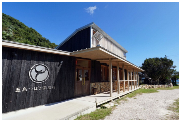
写真11 ● 五島つばき蒸溜所

近年では、まちづくりや観光の面でも、自然とともに生きることが注目されるようになりました。その象徴のひとつが福江島の五島つばき蒸溜所(写真11)です。かつて隠れキリシタンの祈りの場であった半泊 はんどまり 教会(写真12)の横に建てられた蒸溜所です。この地域のボタニカルを使用したクラフトジンの蒸溜所を作るプロジェクトで建てられたこの蒸溜所は、隣接する教会を維持管理する教会守 きょうかいもり として寄り添うように生産を行っていくことを目指しています。建物は修道院のような回廊をもつ独特の設計で、中央の蒸溜室を中庭に見立て、その周囲を静かな回廊が囲んでいます。ガ