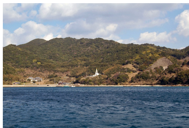
写真5 ● 浜脇教会周辺の集落

解禁後、カトリックに復帰したひとびとにより、島々の各集落に木造教会堂が建てられました。久賀島で最初に建てられた当時の浜脇教会堂は東岸の五輪集落に移築され、旧五輪教会堂として現在も存在しています。外観は和風建築ですが内部は三廊式で、空間構成や祭壇は本格的な教会建築様式であり、国の重要文化財に指定されています。また、禁教期からの墓地は、カトリックの墓地としても使われ、現在も残っています。