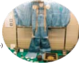
가미시모 (무사의 예복)

고토 가문의 시조는 겐페이 전쟁을 피해 고토열도 최북단 우쿠 섬에 건너와 영주가 된 우쿠 이에모리(宇久家盛)라고 전해집니다. 내란·임진왜란·그리스도교 전래·후쿠에성 축성 등 다양한 역사를 소개하고 있습니다.