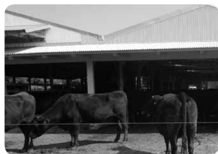
簡易牛舎整備事業で完成した牛舎と増頭された牛

模縮小や廃業も踏まえ、畜産クラスター事業や簡易牛舎の整備事業、キャトルセンターの増設などで、年200頭の増頭を見込んでいく。