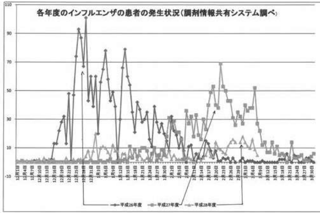
各年度のインフルエンザ発生状況

答弁 システム運用により、薬の飲み合わせや重複投薬の予防など適切な服薬指導のほか、高齢者の