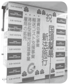
国境離島新法施行を祝うパネル（五島つばき空港）

答弁 これまでに造成した潜伏キリシタン関連遺産を周遊する着地型旅行商品や民泊を中心とした体験型メニューに加え、歴史文化遺産、自然景観を周遊する商品の開発、島でしか味わうことのできない新たな体験プログラムなどを整備し、観光客の「もう1泊」につなげ、それらの旅行商品の販売促進のために各旅行会社が行う割引分に対して助成を行い、結果的に観光客への支援につながるよう取り組んでいきたい。