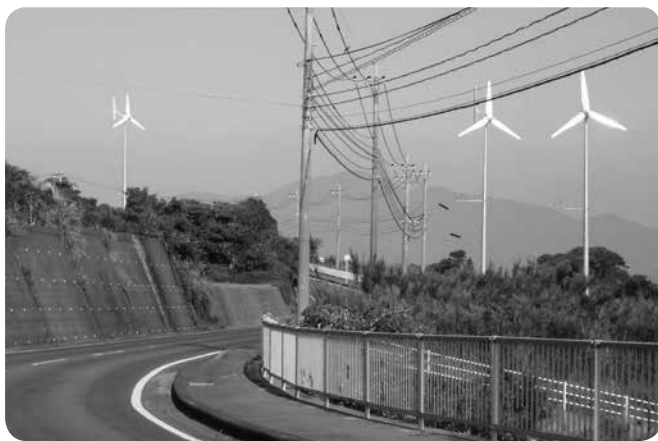
長手地区の小形風力発電施設

質問 小形風力発電施設建設ガイドラインについて、①住宅からの距離を「概ね200m以上離れていること」としている根拠は。②「施設建設に当たっては、地域住民の