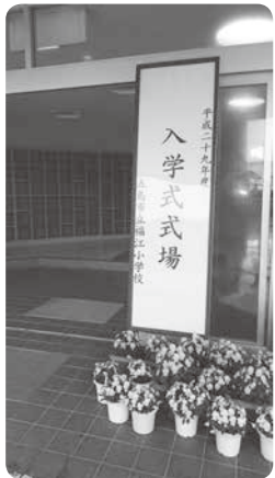
福江小学校の入学式

答弁 就学援助のうち新入学用品費については、現在でも4月中旬には支給しており、県内でも早い時期での支給となっている。入学前に実施するのであれば、より早い時期での支給が効果が高いと考えていることから、平成30年度の小中学校入学者から2月中に支給する方向で進めている。