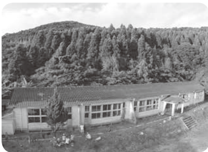
旧富江小学校田尾分校校舎

答 建物は昭和36年3月の建築である。地域活性化の拠点としての利用を条件に無償譲渡されるため、解体せざるを得ない事情が生じた場合には譲渡先となる(仮称)一般社団法人 田尾フラットが費用を負担する。