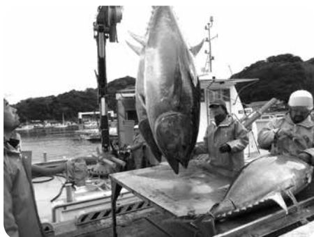
新たに輸送コスト支援の対象となるマグロ

基幹産業である農水産業の振興を図り雇用を拡充するために、農水産品全般（加工品以外）の出荷や原材料の輸送にかかる費用を支援する。