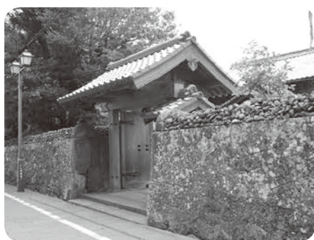
山本二三美術館(仮称)として 整備する武家屋敷松園邸

本市出身のアニメ美術監督であ り、作者でもある山本二三氏の作 品を常設展示する美術館を市指定 文化財「武家屋敷松園邸」を活用 し、平成30年度の開館に向け整備 する。