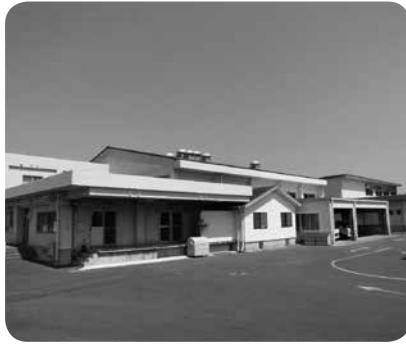
岐宿町内の調理・配送を新たに行う福江学校給食センター

答 三井楽学校給食センターが距離的に近く、処理能力もあることから検討を行ったが、食器類など