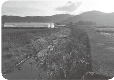
河川に越境した雑木等