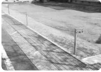
玉之浦観光住民センター跡地

答弁 防風対策に苦慮している状況から、業務全般の効率性を考慮し、鉄筋コンクリート造りで計画している。また、地域の意見については、基本的な考えを踏まえながら、丁寧に調整していきたい。