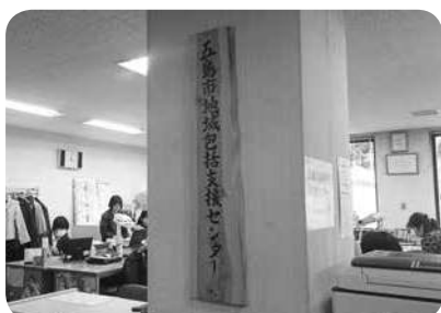
市役所本庁内にある地域包括支援センター

答弁 高齢者のワンストップ相談窓口として、五島市地域包括支援センターを設置して高齢者福祉サービス全般の相談への対応や各種支援へと繋げている。また、五島市高齢者見守りネットワーク連絡会のもとで関係機関が連携した在宅生活を支援する取り組みも進んでいる。