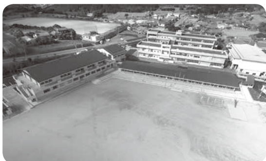
岐宿中学校敷地内に完成した岐宿小学校校舎

また、屋内消火栓設備についても、消防法の規定により設置されており、施設の消防設備は整っている状況にある。