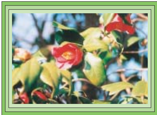
市の花木「ヤブツバキ」

市民のみなさまおよび五島市にゆかりのある方々から御応募いただきました「市の花・木・鳥」につきましては、次のとおりそれぞれ決定いたしました。