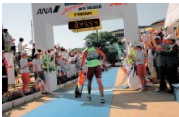
昨年のゴールシーン 五島高校