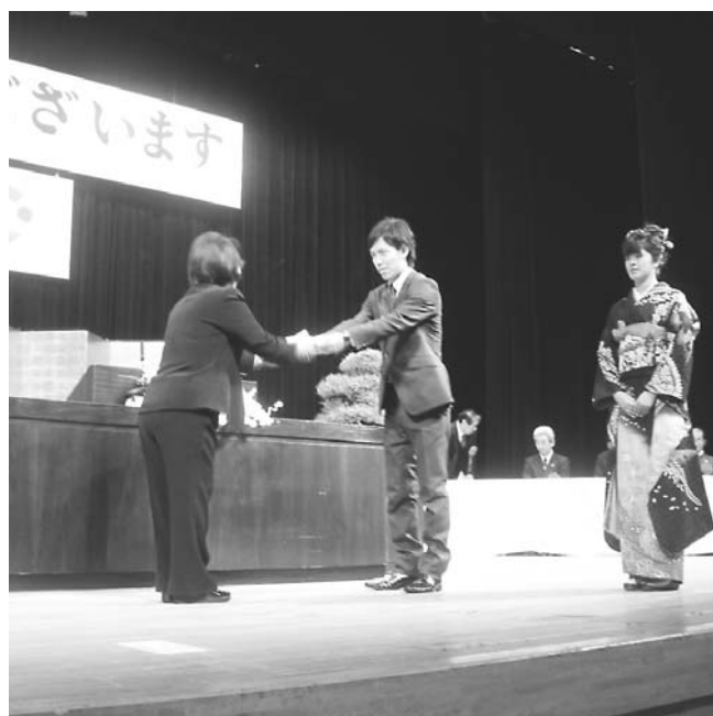
平成20年 成人式の様子