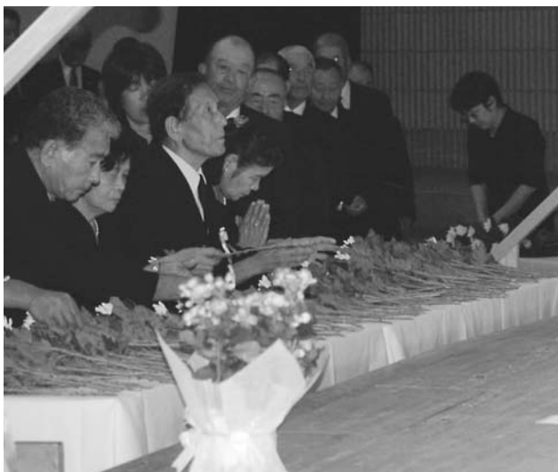
献花し祈りを捧げる参列者