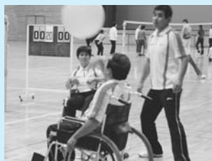
10月26日スポレクフェスタ

会の人数は、約50名。福江総合福祉保健センターで、毎月2回金曜日に練習を行っています。