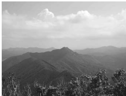
父ヶ岳から望む七ツ岳

最低賃金は、パート・アルバイトを含む県内のすべての労働者に適用されます。詳しいことについては、お問い合わせください。