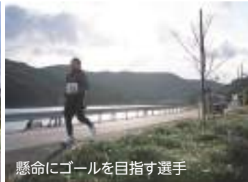
懸命にゴールを目指す選手