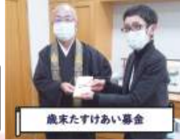
歳末たすけあい募金

12月23日 五島市佛教連合会様。 コロナ禍で托鉢ができない中 新年を健やかに迎えられるようにと の気持ちから、各貴寺よりご寄付い ただきました。