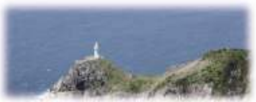
大瀬崎灯台 1971年に今村組が元請施工