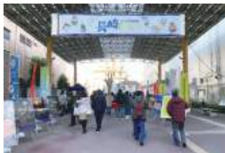
長崎PR展in三軒茶屋の様子