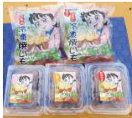
パッケージが印象的で、芋本来の甘さが際立つ芋蔵林の商品

す！」と笑顔で話してくれました。丁寧な手作業で作られた芋蔵林の芋商品は、ふるさと納税の返礼品としても人気。ぜひ五島の大地の味をご堪能ください。