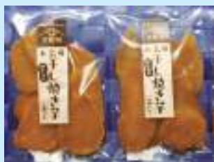
新商品の「干し焼き芋」