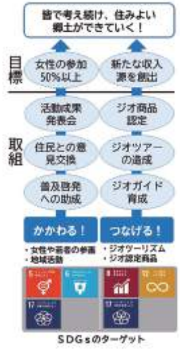
「持続可能な開発」の取組と目標の図

そのために重要な役割を果たすのがジオガイドです。五島列島ジオパーク推進協議会では、令和2年度にガイド養成講座を実施し、地域の魅力や地球の大切さを伝える27名のジオガイドが誕生しました。