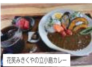
花笑みきくやの立小島カレー