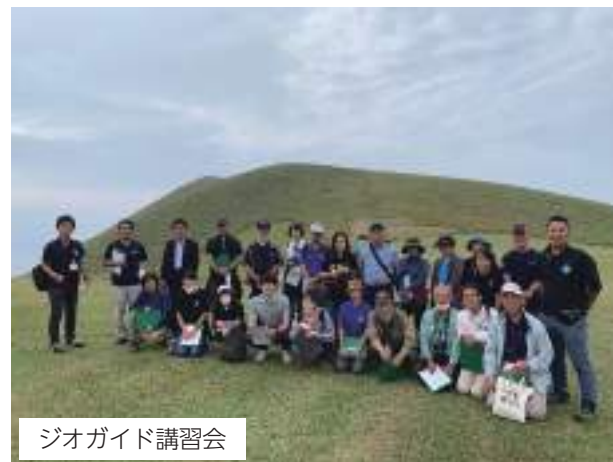
ジオガイド講習会