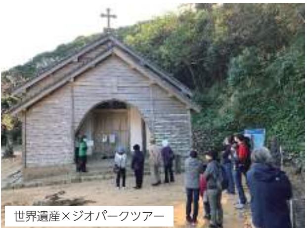
世界遺産×ジオパークツアー