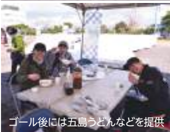
ゴール後には五島うどんなどを提供