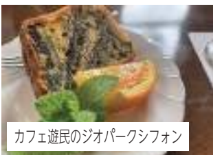
カフェ遊民のジオパークシフォン