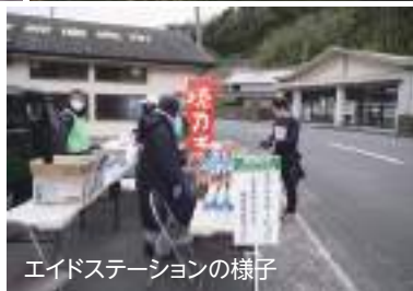
エイドステーションの様子