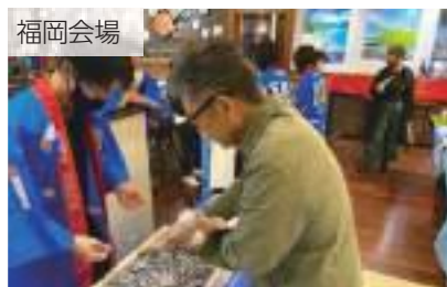
五島沖で採れたきびなごのつかみ取り