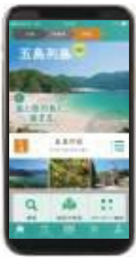
観光情報発信アプリ「STLOCAL」