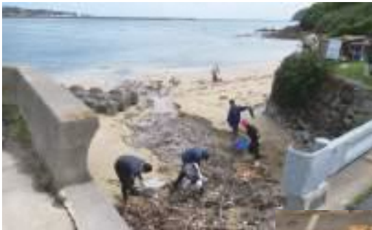
△クリーンアップ作戦の様子