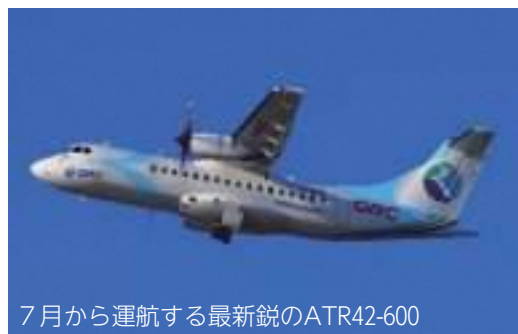
7月から運航する最新鋭のATR42-600

2つ目は、長崎-五島間を運航する最新鋭のATR42-600。これまで島民の翼として私たちの暮らしを支えてくれたDHC8-201型に代わり、7月1日の2便目から就航します。座席数は9増えて48になります(1便目はこれまでどおり74人乗りのDHC8-400型です)。2機目は7月上旬に長崎空港に到着し、段階的な準備期間を経て導入する予定です。乗り降りはいこれまでと違って後方になります。