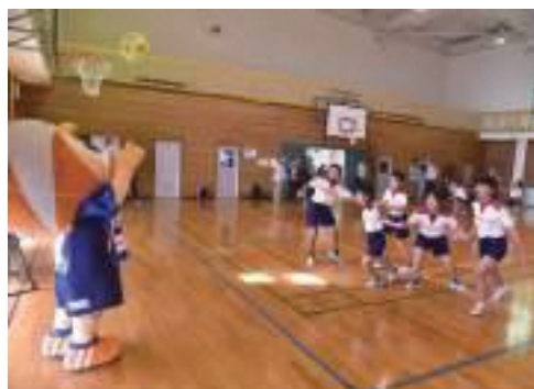
チームで協力しながら、ゲームに挑む児童たち