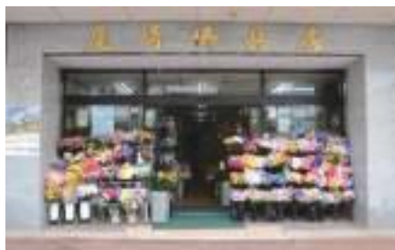
創業から約180年続く老舗 尾崎神佛具店