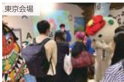
クイズに答えてGoto五島!

今後の観光・物産の需要回復を見据え、引き続き首都圏・大都市圏でのPR活動を展開していきます。