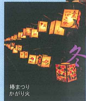
橘まつり かがり火