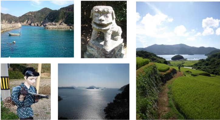
久賀島観光交流拠点センター

最盛期には約4,000人いた人口は、今では350人程に。人口減少が進む島の学校存続に向け、平成28年4月から、島外の児童生徒を受け入れる「しま留学制度」を導入しています。