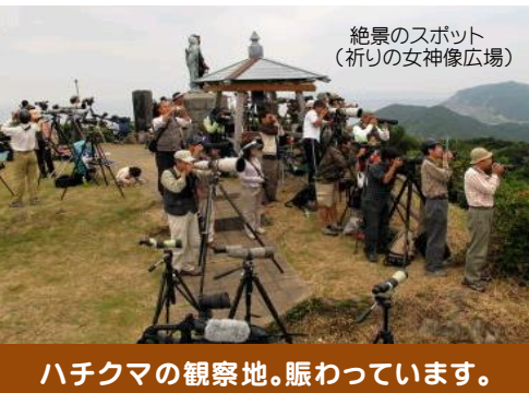
絶景のスポット (祈りの女神像広場)