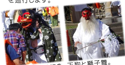
またここにも、天狗と獅子舞。 ご利益がありますように・・・。