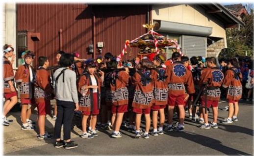
子ども達も、神輿を担いで参加します。