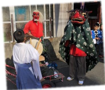
天狗と獅子舞。 お祭りにはつきものですね・・・。