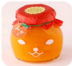
つばきねこジャム びんづめ専門店くまごろうの無添加ジャム。甘くておいしい♪