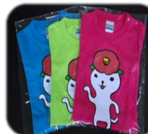
Tシャツ 大人も子どももこれを着ると人気者になれるよ♪