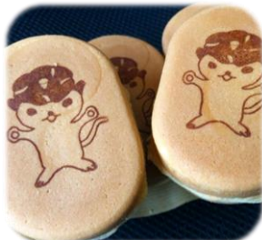
大判焼き 繁栄堂の大判焼き。黒あん、白あん、芋あん... etc 色々あるよ♪