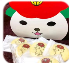
つばきねこクッキー おみやげに大人気! みんなに喜ばれること間違いなし♪