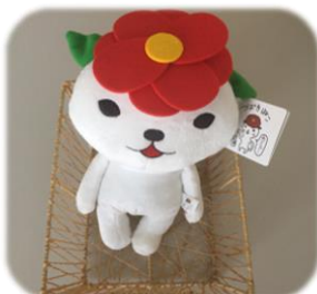
ぬいぐるみ いつでも一緒♪つばきねこといるんなところにお出かけしよう。