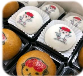
求肥&黒糖まんじゅう 求肥¥150、黒糖まんじゅう¥120ととってもリーズナブル。三葉家で買えるよ♪