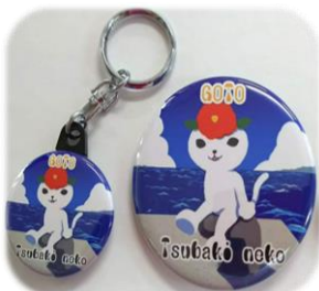
キーホルダー&缶バッジ バッグに気軽につけられるかわいいグッズ♪値段もお手頃だよ。