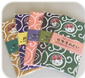
手ぬぐい 綿100%で肌触りバツグンの手ぬぐい。日本製だから安心して使えるね。