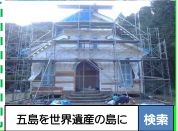
五島を世界遺産の島に 検索

パンフレットを欲しい方は、お送りしますので、お気軽にご連絡ください。 五島市政策企画課 ☎0959-1721-6782