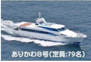
ありかわ8号(定員:79名)

五島市福江島と佐世保市を結ぶ定期航路の旅客船が就航します。ご来島の際には、ぜひご利用ください。