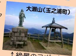
↑絶景のスポット(祈りの女神像広場)