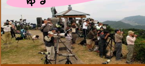
シーズン中の観察地。賑わっていますね。