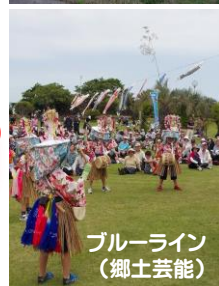
ブルーライン (郷土芸能)