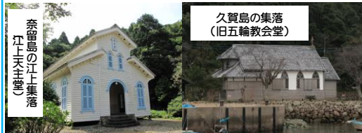
久賀島の集落 (旧五輪教会堂)