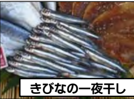
きびなの一夜干し