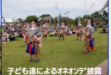
子ども達によるオネオンデ披露