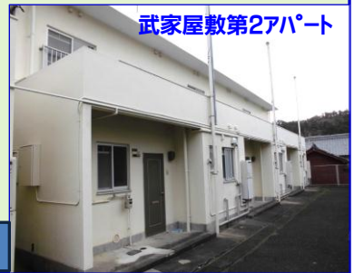
武家屋敷第2アパート