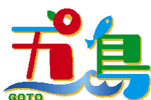
五島市の統一 ロゴマークです。