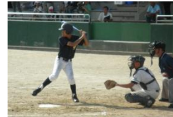
打者が五島パラモンの選手

8月19日から22日にかけて嵯峨市で開催された離島甲子園。五島市からは岐宿中学校野球部が「五島パラモン」として出場し、大会第3位と健闘しました。