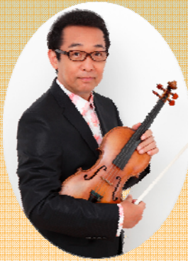
さだ まさし 長崎市出身

皆さまご存知のシンガーソングライター、さだまさしさん。タレント・小説家としてもご活躍されていますが、五島市歌「～燦々と～」の補作詞・作曲をしていただいたことがきっかけで「五島市ふるさと大使」になっていただきました。 「世界一美しく澄んだ海、そしてどこまでも透きとおる空。その土地に歴史と文化がしっかりと刻みこまれた信仰の島、五島列島は漁業ばかりではなく畜産の島でもあり農業の島でもあり更に麵の島でもあります。そしてこの島の価値を更に高めてくれるのが、素晴らしい風景だけではなく、温かい人々と、その心遣いに支えられた美味しい食べ物の数々なのです。ふるさとにこんなに美しい島があります、と世界中の人に伝えたいと思います。」