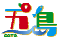
五島市の統一 ロゴマークです。