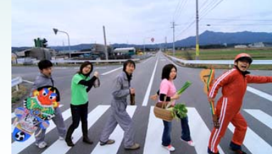
右からベベンコビッチ、ポッパポバルバ、ドスグロカッチ、ギッコンパッコン、パップドシク

彼らの楽曲は、インターネットYoutubeなどで聴くことができます。また、五島弁満載のブログも是非ご覧になって、懐かしい五島弁を思い出してください。