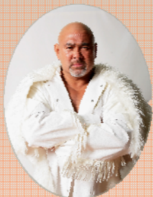
武藤 敬司 山梨県出身

全日本プロレス代表取締役社長をされています。 現役プロレスラーとしてご活躍されており、得意技は“シャイニング・ウィザード”です。 昨年10月にプロレスイベントで来島された事をきっかけに五島市を応援していただくこととなりました。 「このたびは、『五島市ふるさと大使』に就任しまして、大変光栄に思っています。 先日、全日本プロレスの興行を行った際には島民の皆さんの暖かい声援や美味しい食べ物をいただき、私をはじめ選手一同五島市が益々好きになりました。 これからも五島市ふるさと大使として、島民の皆様と力を合わせて行きたいと思っております。」