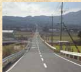
【岐宿】二本楠の直線道路(福江～荒川)