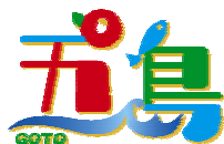
五島市の統一 ロゴマークです。