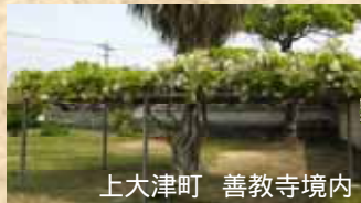
上大津町 善教寺境内

五島市の奈留島で全国初の公立小中高一貫教育が平成20年度から始まりました。校舎は奈留高校と奈留中学校(小中学校)の校舎を活用しています。今年度児童・生徒数は小学生113名、中学生81名、高校生87名となっています。