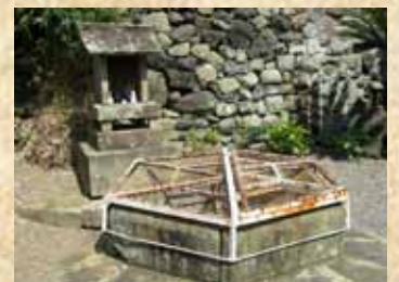
【福江】江川町六角井