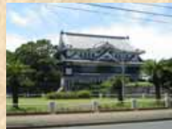
五島市観光歴史資料館 外濠公園