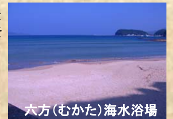
六方(むかた)海水浴場