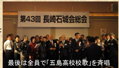
最後は全員で「五島高校校歌」を斉唱

今回の出席者は約80名で、出席者の減少や若年者の出席が少ないことを苦慮されておりましたが、もちまわりの幹事年度にあたる方々の司会・余興で盛会でした。ふるさと市民のパンフレットも配らせていただきました。