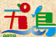
五島市の統一 ロゴマークです。