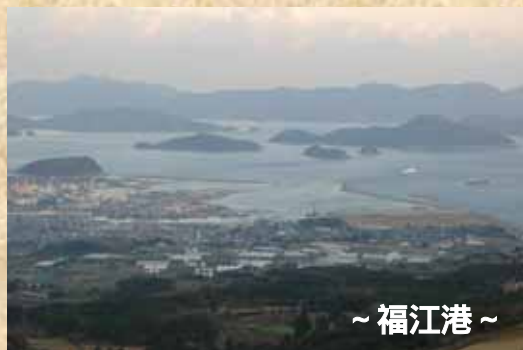
～ 福江港 ～