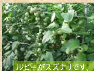
ルビーがズナリです。

中玉トマト(3~4cm)の収穫を行っています。 五島市の富江地区、本山(もとやま)地区で10月下旬から収穫が始まりました。 耐候性ハウスを利用した栽培で、来年6月ごろまで収穫できるそうです。 主に関東方面に「 五島ルビー 」という商品名で出荷されています。 栽培農家はエコファーマー認定の14戸、平成15年から栽培を始めています。 とっても甘く、皮も薄く、2つに切ると一口大になりとても食べやすいトマトです。 赤い野菜が少ない時期には重宝します。